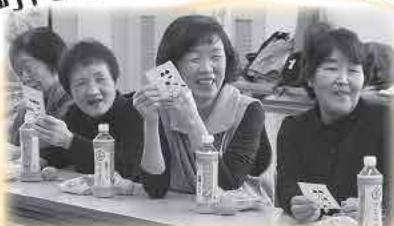
笑顔あふれる ビンゴ大会