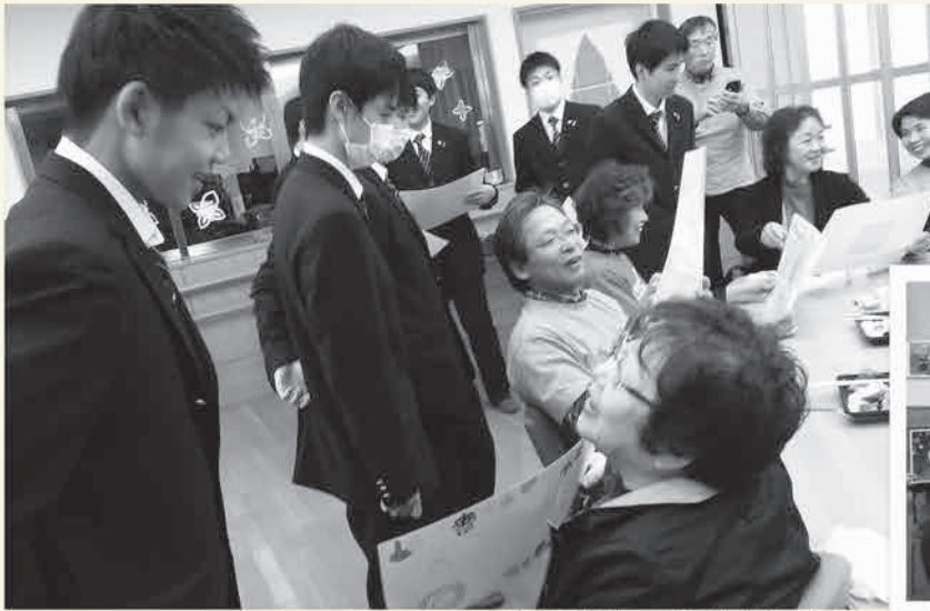
ステキな贈り物で会話が弾みます