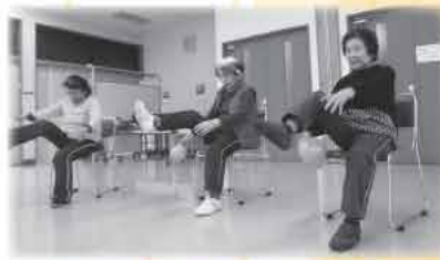
ボールを使って1・2・3!