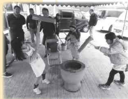
子どもたちもお手伝い

「地域のつながりをより強くし、孤立をなくす活動」として催され、その内容はお餅つき、クリスマス会、お楽しみ会と多岐にわたり、それぞれの団体が工夫を凝らした会になっていました。皆さんの募金、そして活動の一つ一つが「地域をよくするしくみづくり」に繋がっています。