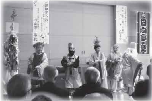
日出町七福愛好会の皆さん