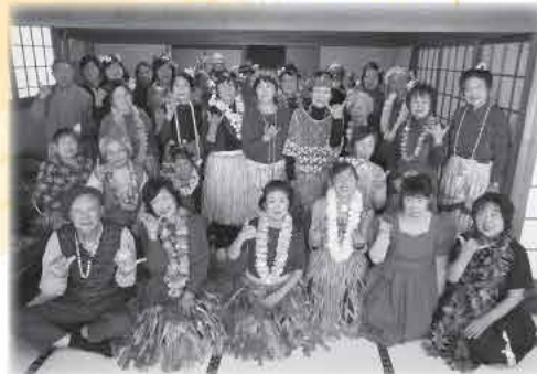
元気の秘訣は歌って!笑って!