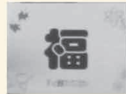
ランチョンマット 「福」!