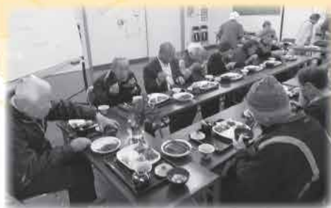
皆で食べるとおいしいな〜♪