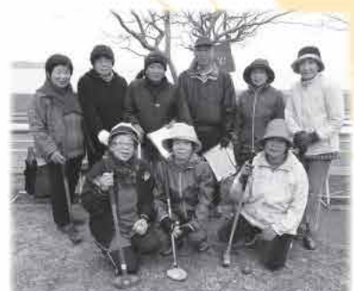
目指せ、ホールインワン!