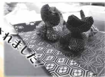
手芸教室で かわいいネコができました

共同募金「歳末たすけあいぬくもり助成金」を活用して、昨年暮れから新年にかけて町内の様々な場所で区・サロンを中心とした交流会が開催されました。