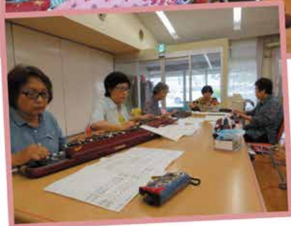
琴藤智会の方が大正琴で大演奏！