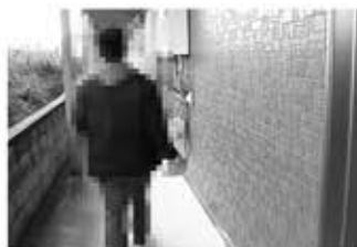
相談員と外回りのお手伝い

「生活リズムを安定したい」との希望でパソコン講座に参加。ときには軽めの運動を相談員の方と一緒にしたりとか。