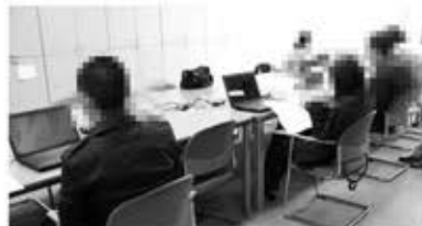
週1回のパソコン講座