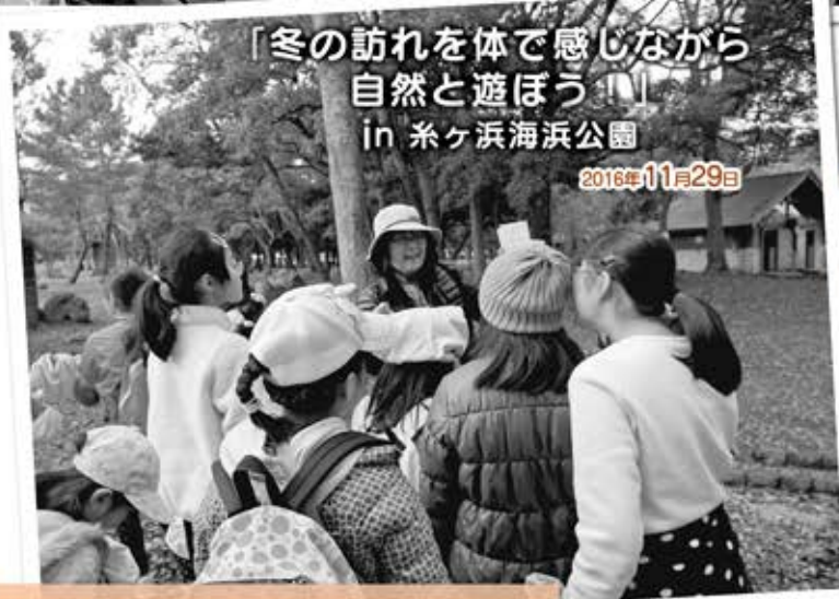
「冬の訪れを体で感じながら 自然と遊ぼう」 in 糸ヶ浜海浜公園