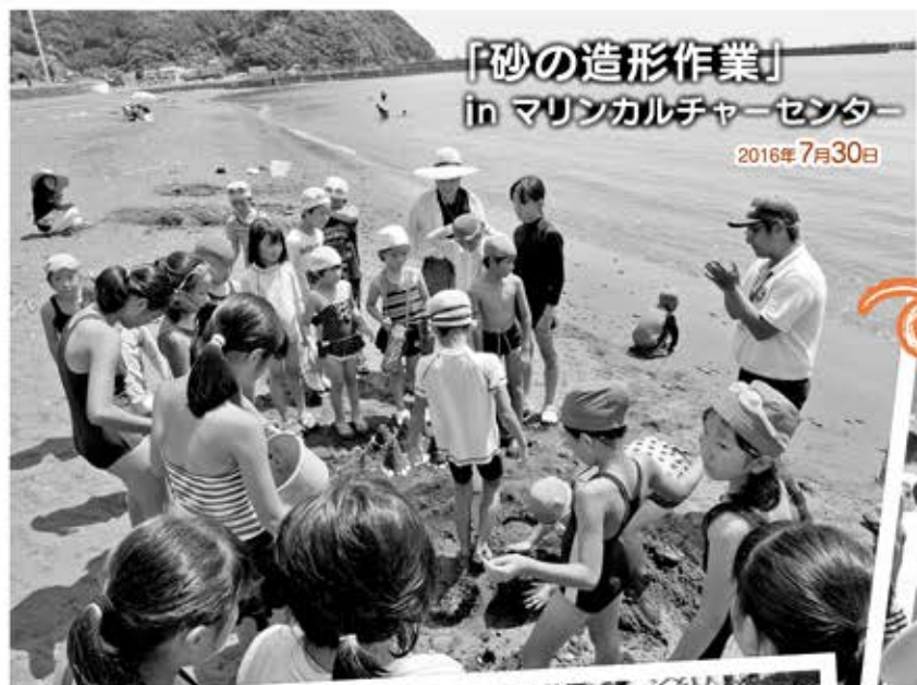
「砂の造形作業」 in マリンカルチャーセンター